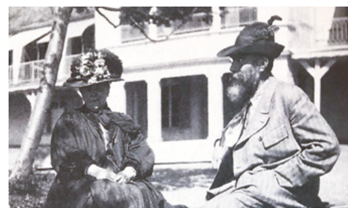
Im Hotelgarten Rigi-Scheidegg