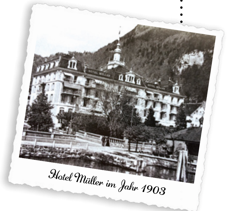
Hotel Müller im Jahr 1903