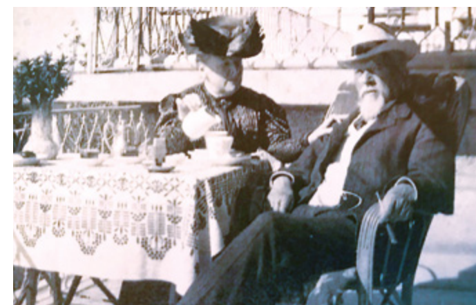
Im Hotelgarten Rigi-Scheidegg